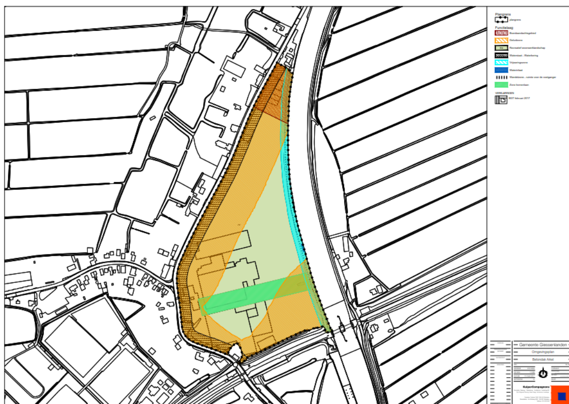
Verbeelding Voorontwerp Omgevingsplan

http://www.ruimtelijkeplannen.nl/web-roo/roo/bestemmingsplannen?planidn=NL.IMRO.0689.OP1013-von1